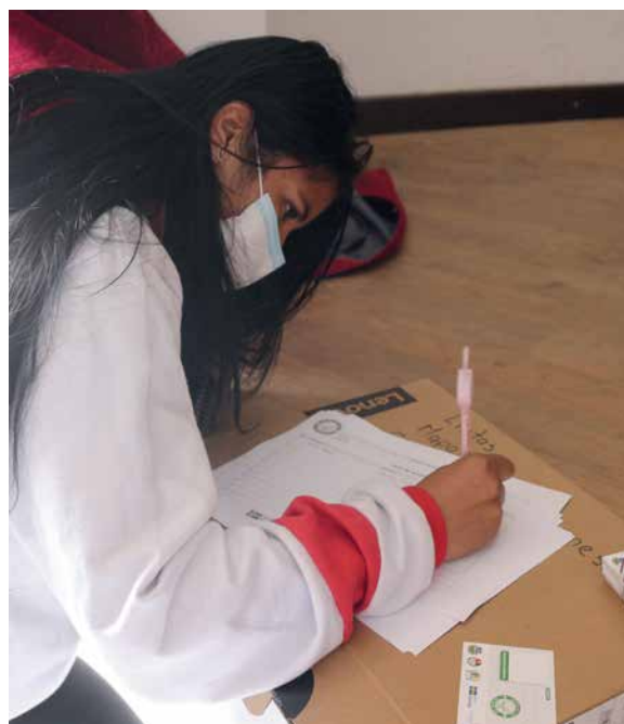
Registro de brigadista en lista.

Se invita al estudiante a participar de la primera reunión de invitación de la "Brigada Ambiental Municipal" que se llevará a cabo el día 18 de marzo del presente año en el "Salón rojo" del municipio a horas 14:00.