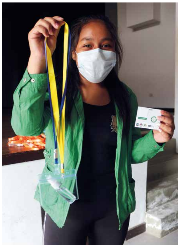
Brigadista recibe su credencial para la movilización.