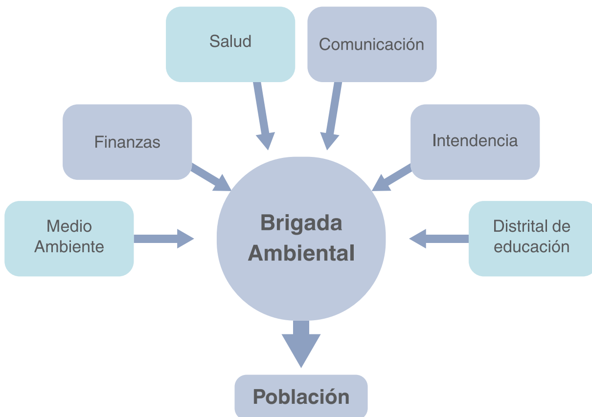
Como se observa en el gráfico, la brigada puede trabajar con diferentes áreas de la alcaldía para socializar con la población información de interés del municipio.