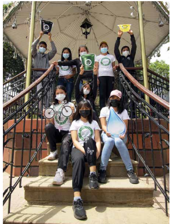
Brigada ambiental Tukuyinchejapaj del Valle Alto

Es muy importante recordar que el corazón de este proyecto es la participación de los voluntarios. Es fundamental valorar su trabajo para la continuidad de las acciones municipales y para su propia autoestima, ya que visibiliza su labor y liderazgo ante la sociedad, sus pares y su familia.