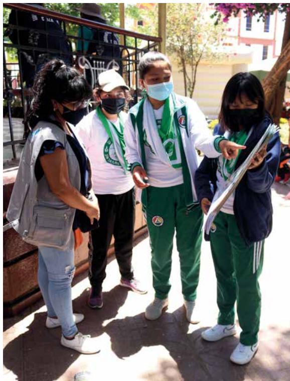
Brigada ambiental en movilización

Para conformar una brigada ambiental se debe trabajar con aliados estratégicos que puedan liderar diferentes actividades y así lograr la sostenibilidad de las acciones.