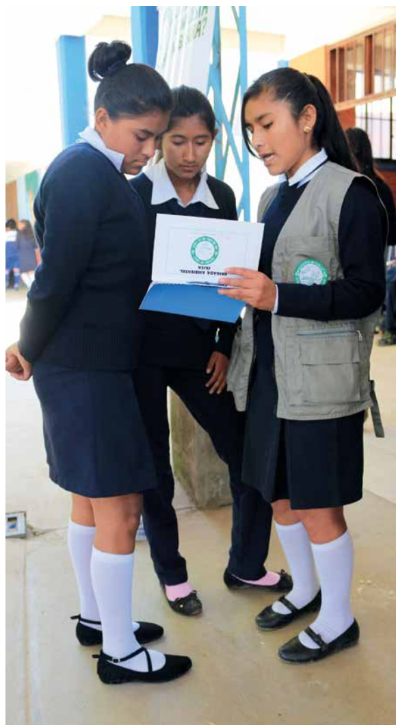
Brigadistas invitando a nuevos voluntarios.