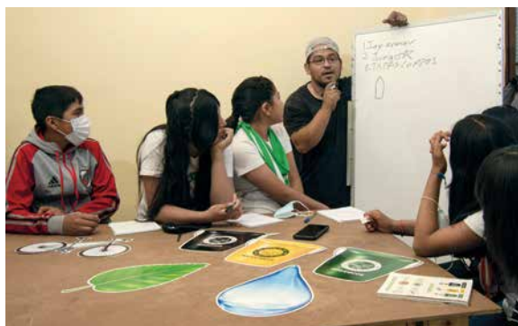
Brigada ambiental Tukuyninchejpaj planificando las actividades de capacitación.

Al realizar estas actividades con el acompañamiento del municipio se crearán espacios donde los vecinos puedan expresar sus falencias y proponer posibles soluciones de manera conjunta. Durante estas actividades se debe generar un espacio de diálogo horizontal, empatía y conciliación.