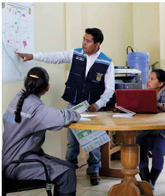
Personal municipal en planificación para movilización de la brigada

Municipio: Delega un área responsable de la coordinación y manejo de la brigada. Éste coordina las acciones con los promotores de las brigadas, las diferentes áreas de la alcaldía que puedan requerir el apoyo de la brigada, la dirección distrital de educación, las unidades educativas, OTB y otros para viabilizar la conformación y planificar el trabajo de los brigadistas.