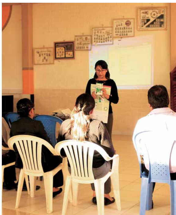
Reunión con director distrital y directores de unidades educativas de Tolata.

Antes de empezar este proceso que involucra directamente a los jóvenes, son necesarias las siguientes acciones preliminares que debe realizar el municipio con el apoyo de los promotores de brigada.