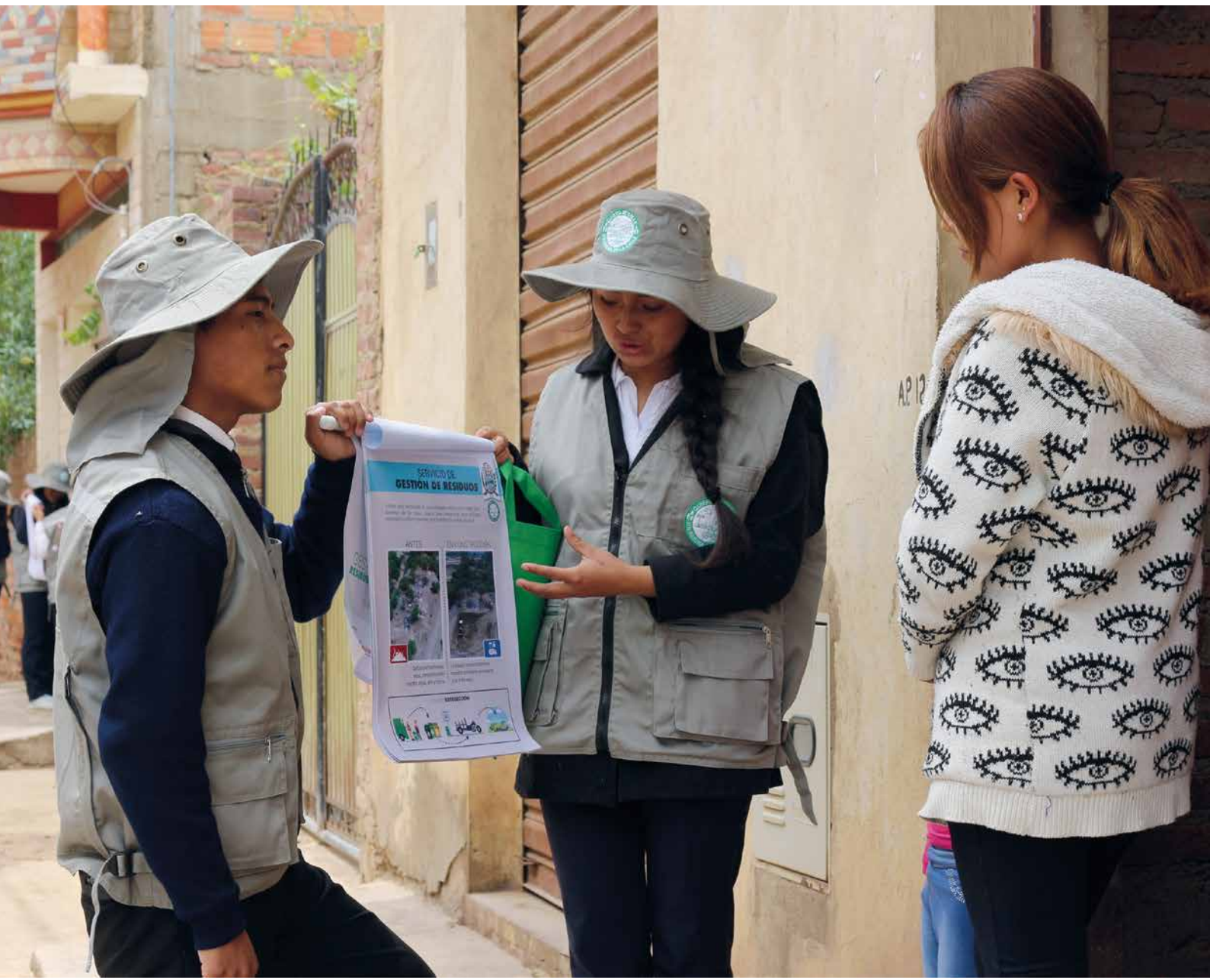
Brigadistas en movilización puerta a puerta en el municipio de Cliza