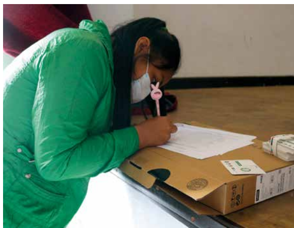
Brigadista en Tarija firma planilla de registro.

Esta guía es una base para la creación de una brigada ambiental municipal. La programación y realización de cronogramas son de suma importancia, ya que permiten establecer qué se necesita y con quiénes se debe coordinar. Este no es un trabajo de brigadistas, sino es un trabajo conjunto entre todas las direcciones de la alcaldía y los técnicos, mientras que la brigada es quien ejecuta la planificación.