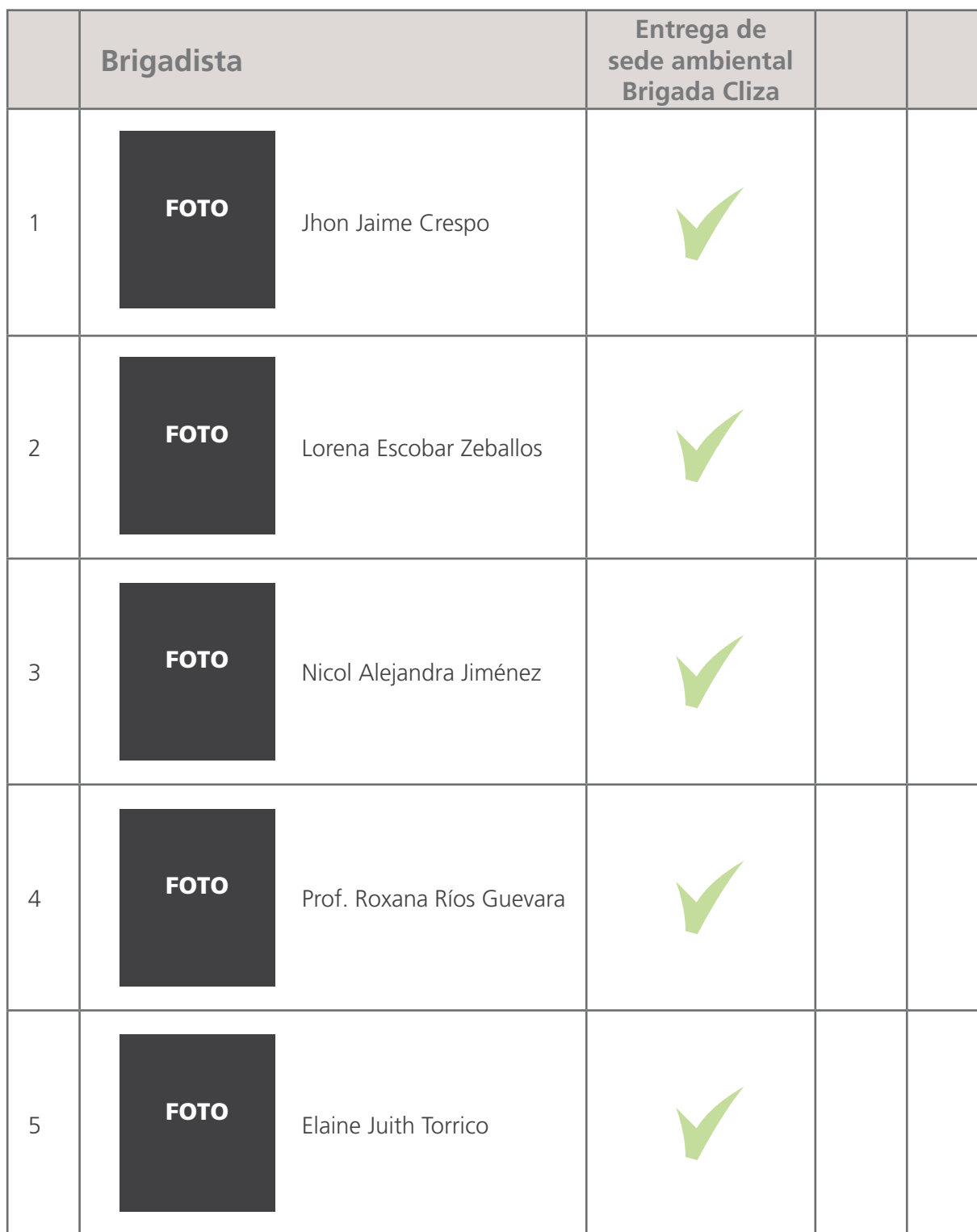
Tabla de Asistencia a actividades y reuniones